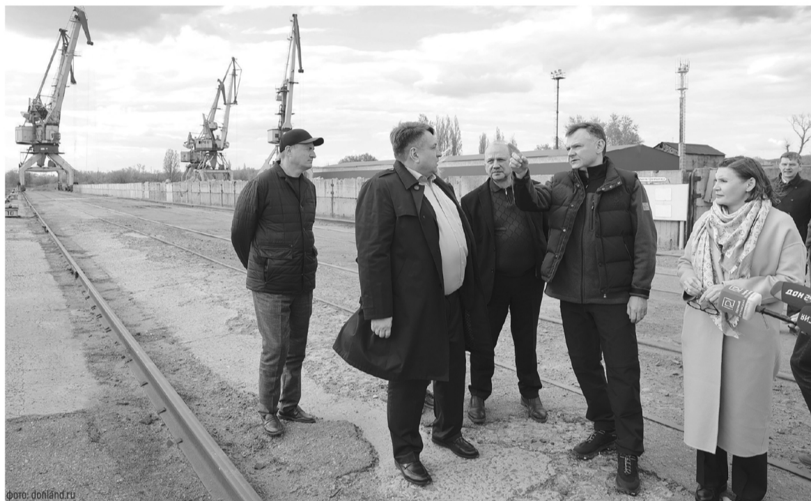
Усть-Донецкий порт - важный узел транспортной инфраструктуры региона

ния перечня в регионе было реализовано 109 проектов. Большинство из них приходится на традиционные для донского края отрасли: промышленное производство, включая топливно-энергетический комплекс, и сельское хозяйство.