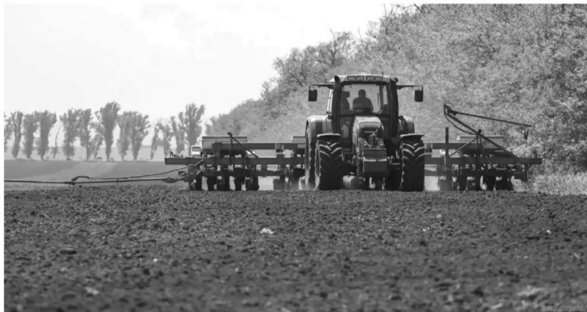
Сельхозпроизводство для Ростовской области остается одной из главных отраслей

Ростовская область – один из ведущих экспортеров России с долей около 12% и географией поставок более чем в 100 стран. Юрий Слюсарь подчеркнул, что в 2025 году наметился рост экспорта продукции переработки: мяса птицы, сыров, творога, муки. Чтобы поддержать эту тенден-