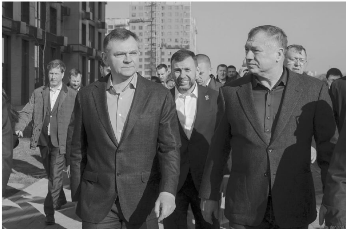
Ростовская область активно сотрудничает с федеральным центром в сфере реализации крупных инфраструктурных и строительных проектов

Достижениями и перспективами может похвастать строи-