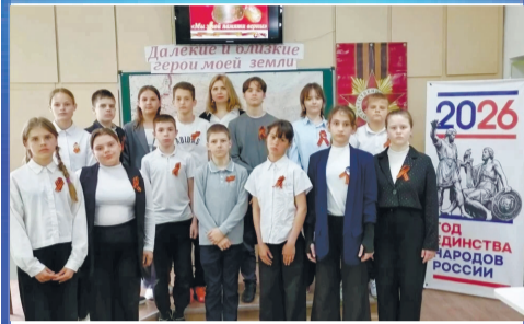
ПАТРИОТ Далекие и близкие герои моей земли

Общественно-политическая газета Кагальницкого района Издается с 28 декабря 2002 года