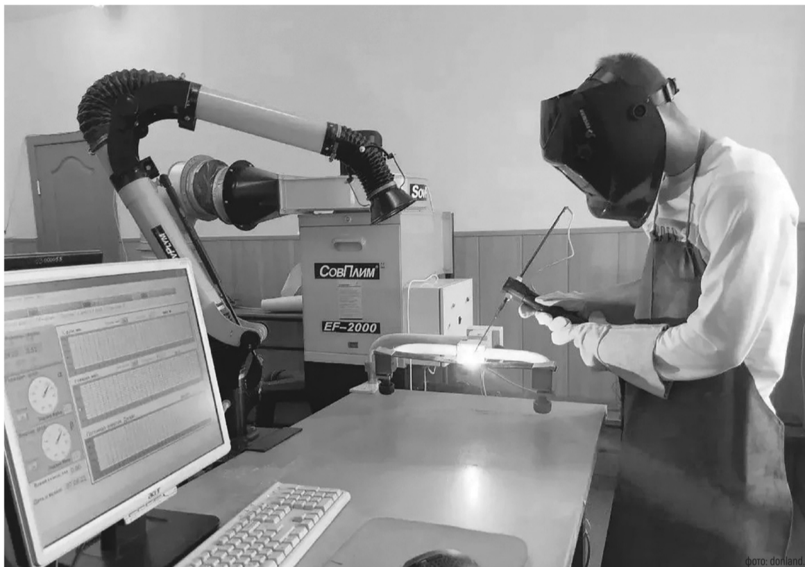
Подготовка инженерных и технических кадров – важный этап в становлении технологического лидерства страны

У нас их две. На базе опорного вуза – Донского государственного технического университета в сотрудничестве с «Рост-