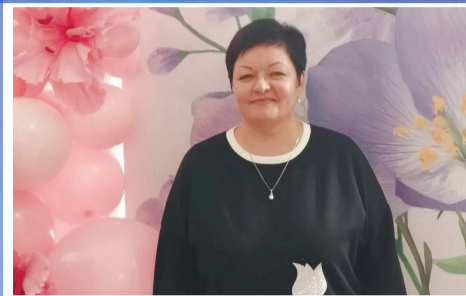
НАШИ ЛЮДИ С глубоким уважением и восхищением