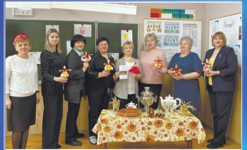
ОБРАЗОВАНИЕ РМО школьных библиотекарей