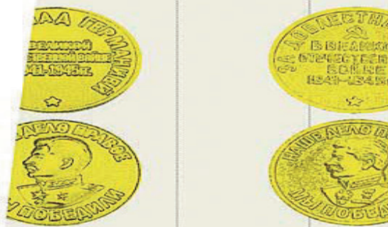
13667000 ЗА ПОБЕДУ НАД ГЕРМАНИЕЙ