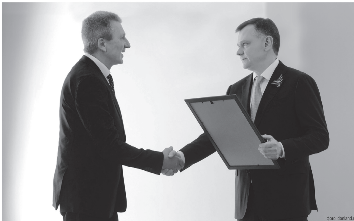
Юрий Слюсарь вручил награды главам лучших поселений по итогам 2025 года

Отметим, что в органах местного самоуправления Ростовской области трудится более 11 тысяч муниципальных служащих, еще более 4 тысяч человек – депутаты представительных органов.