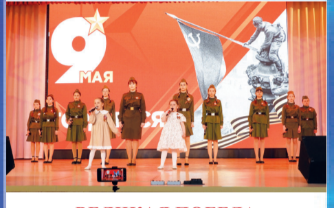
ВЕЛИКАЯ ПОБЕДА Волонтеры Победы