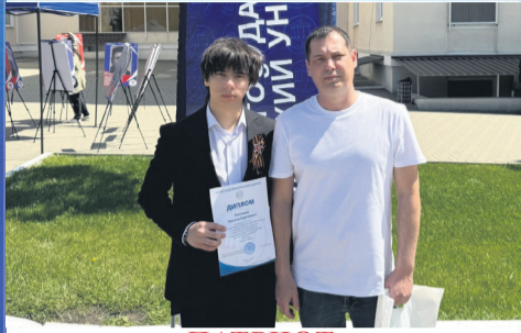
ПАТРИОТ Патриотическое воспитание в действии

Общественно-политическая газета Кагальницкого района Издается с 28 декабря 2002 года