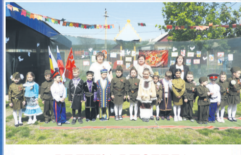
ВЕЛИКАЯ ПОБЕДА Фронтная поляна