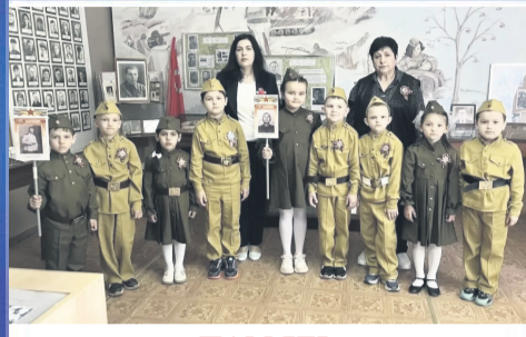
ПАМЯТЬ День самых важных ценностей