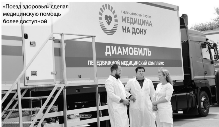
«Поезд здоровья» сделал медицинскую помощь более доступной

В программе принимают участие более сотни действующих военнослужащих и ветеранов СВО.