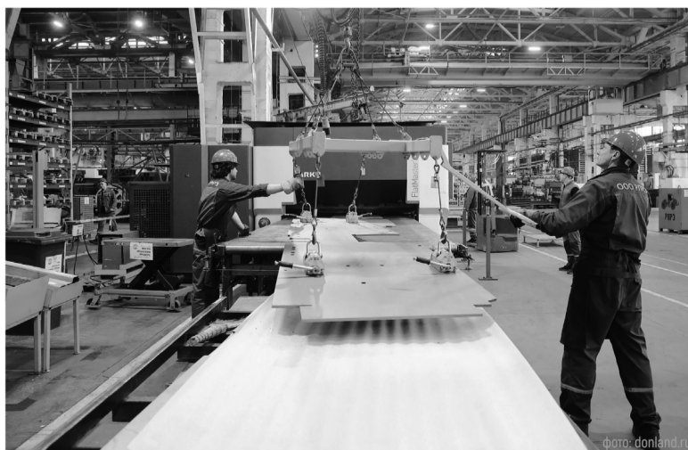
Наибольший вклад в экономику области – порядка 22% – вносит промышленность, которая по итогам прошлого года показала рост

Да, в 2025 году объем производства сельхозпродукции снизился до 390 млрд рублей – это на 17% меньше, чем в 2024 году. Но удалось сохранить место в пятерке лучших регионов по производству сельхозпродукции: по зерновым и зернобобовым культурам – 3-е место в России, по овощам – 5-е.