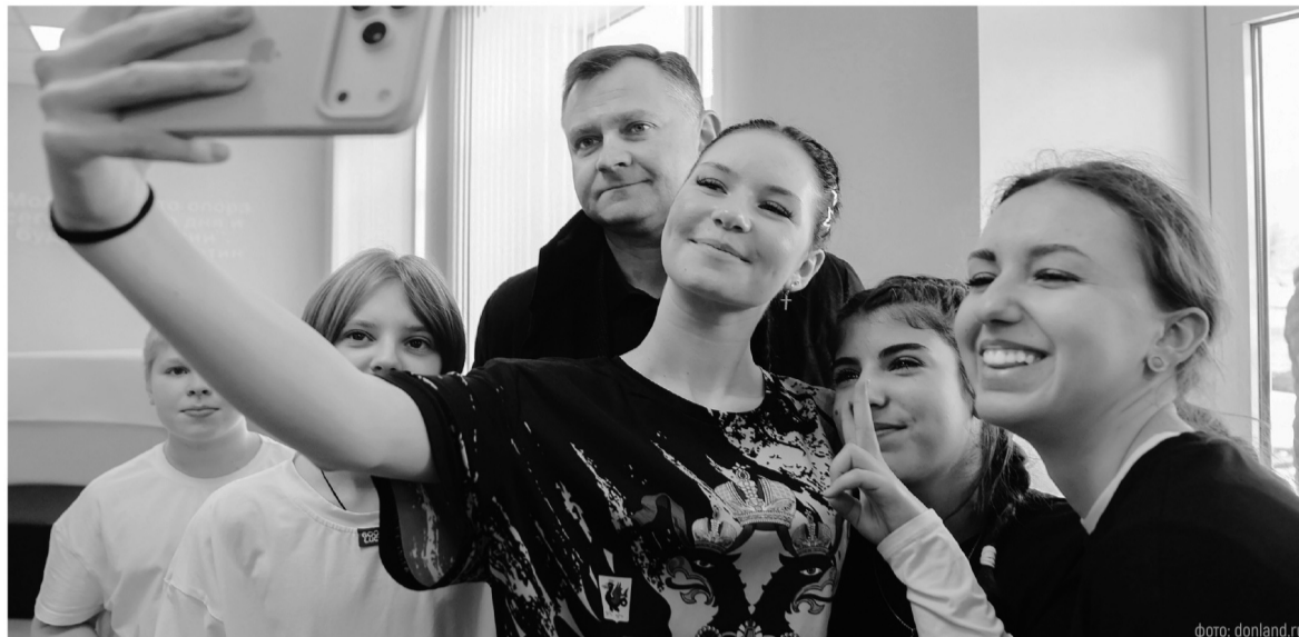
Рекордное за последние несколько лет количество учебных заведений – 12 новых школ – открылось в прошлом году на Дону

Региональную программу рождаемости дополняли новыми ме-