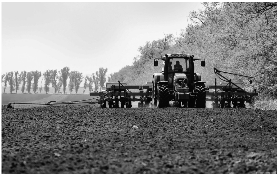
Ростовская область сохранила лидерские позиции по сельхозпроизводству

Чтобы привлечь дополнительные средства, с «Ростовэнерго» и «Донэнерго» были заключены шестилетние регуляторные соглашения. Это даст около 22 млрд инвестиций в электросетевой комплекс.