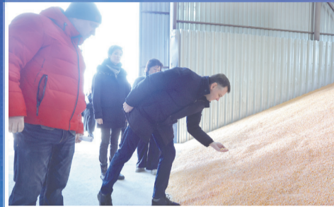
НОВОСТИ ОБЛАСТИ Новые векторы донского агропрома