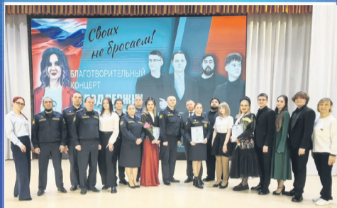
ПАТРИОТ Музыка, объединяющая сердца

Общественно-политическая газета Кагальницкого района Издается с 28 декабря 2002 года