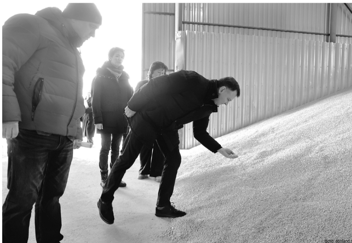
Переработка сельхозпродукции в регионе – один из ведущих драйверов развития аграрной отрасли

– Мы сохранили поддержку на достаточно высоком уровне. 8,1 млрд рублей – это сумма немаленькая в нынешних условиях. Задача-максимум – этот