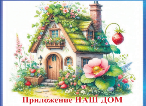
Приложение НАШ ДОМ