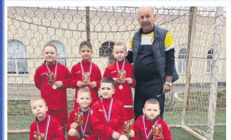
СПОРТ Кубок Сокола по футболу