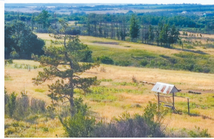
НОВОСТИ ОБЛАСТИ Сохранить для будущих поколений