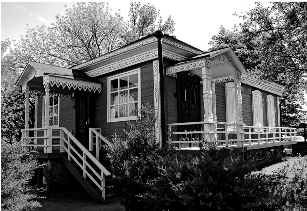
Например, в Волгодонске можно увидеть настоящий казачий курень XIX века, посетив Музей истории донской народной культуры, ремесел и быта

К тому же интерес молодежи к культурной жизни региона заметно вырос. По данным банка «ВТБ» – оператора программы «Пушкинская карта», с начала этого года юные дончане потратили на посещение культурных мероприятий по «Пушкинской карте» 82 млн рублей, выдано 187 тысяч карт. При этом хотя бы один раз картой воспользовались 84 тысячи человек, а месяц назад таких пользователей было около 60 тысяч – рост показателя на 40%.