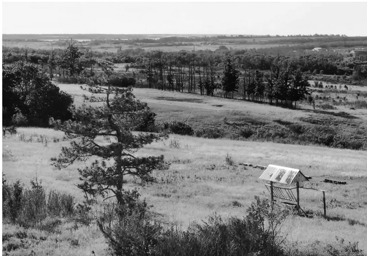
Восстановление биоразнообразия, сохранение водных и лесных ресурсов региона – ключевые задачи на этот год

Глава региона отметил работу главных защитников леса – пожарных. В 2025 году произошедшие пожары были ликвидированы в первые же сутки. Для обеспечения такой оперативной работы, а также профилактики возгораний в регионе созданы все условия. На территории области действует 21 лесопожарная станция. Предупреждать пожары помогает система видеомониторинга – в прошлом году 86 камер были интегрированы в комплекс «Безопасный город». Область также продолжает обновлять парк лесопатрульной техники. Все эти меры – вклад в сохранение лесов.