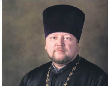
НАШИ ЛЮДИ Образ жизни - служение Богу