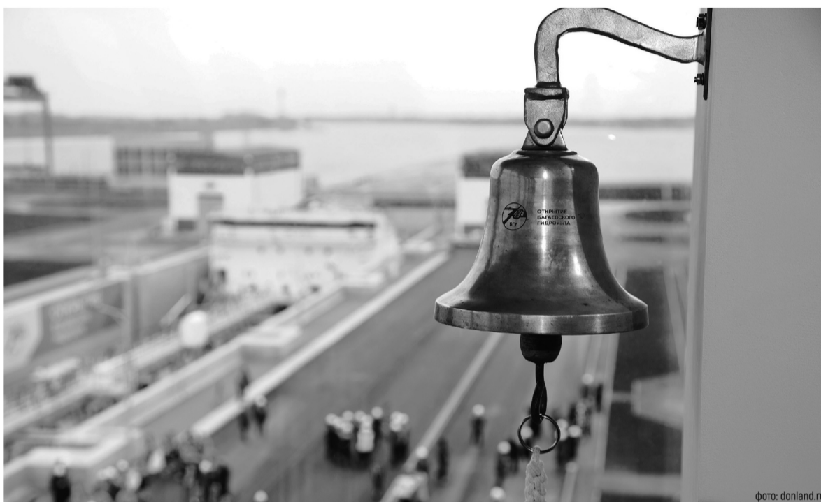
Первым через Багаевский гидроузел прошел самый большой танкер из тех, что будут передвигаться по этому водному маршруту

– Я бы хотел отметить еще ряд сопутствующих положительных эффектов, которые касаются возможности увеличения и улучшения водоснабжения и решения вопросов, связанных с мелиорацией прилегающих территорий, – сказал Владимир Путин. – Это и для других отраслей, в том числе для сельского хозяйства, надеюсь, будет иметь положительный эффект. 900 специалистов работа-