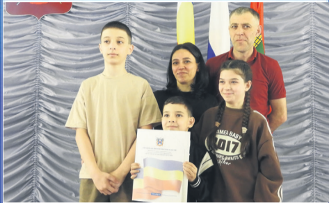
О ВАЖНОМ Земельные сертификаты для многодетных семей

Общественно-политическая газета Кагальницкого района Издается с 28 декабря 2002 года