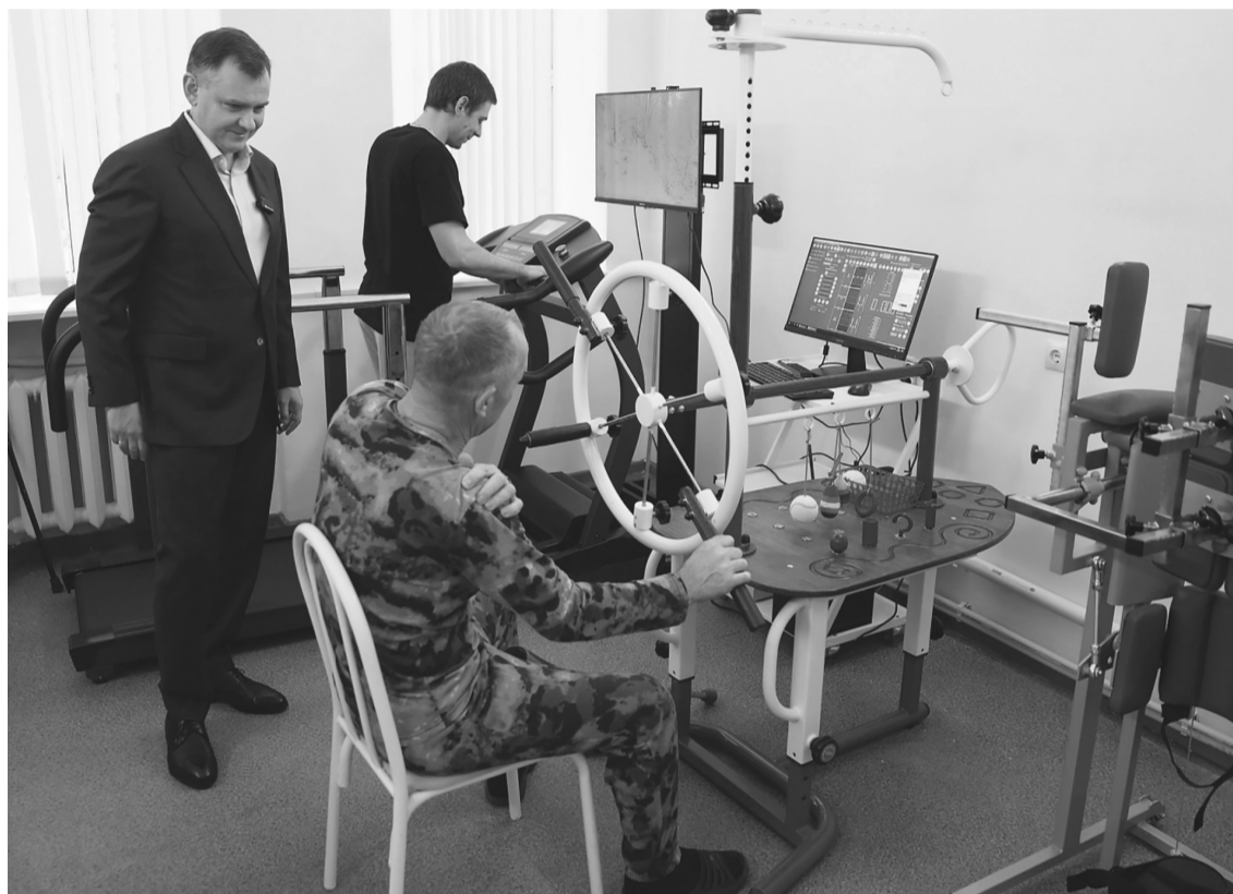
Всесторонняя поддержка бойцов СВО сейчас главный приоритет

Глава региона осмотрел кабинеты отделения реабилитации, палаты и пообщался с военнослужащими, интересовался, как проходит восстановление,