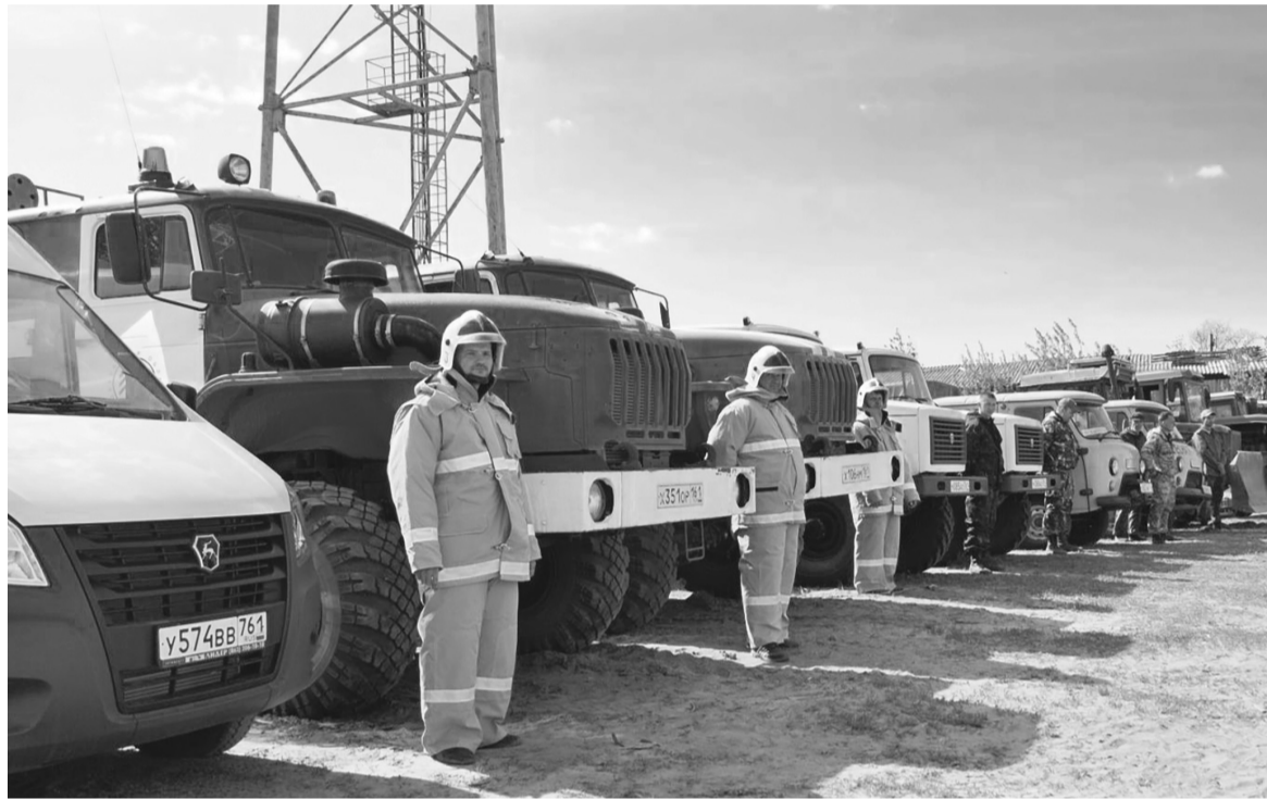
Донские огнеборцы всегда готовы защитить. И мы можем им помочь своим бережным и внимательным отношением к противопожарным правилам

Это значит, что нам всем необходимо быть особенно внимательными в своей повседневной жизни. Основной причиной пожаров из года в год остается неосторожное обращение с огнем. По информации главного управления МЧС по Ростовской области, за шесть месяцев этого года из 3,8