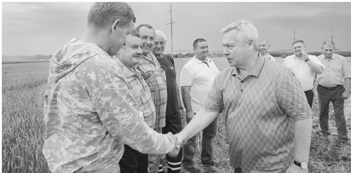
Несмотря на неблагоприятные погодные условия, донские сельчане собрали достойный урожай

– Упорный труд сельчан, опыт, грамотная подготовка к каждому сезону, – подчеркивает губернатор, – все это позволяет Ростовской области уже несколько лет подряд