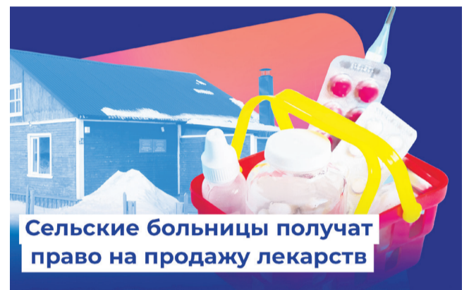
Сельские больницы получают право на продажу лекарств

Речь идет о тех населенных пунктах, где нет стационарных аптек.