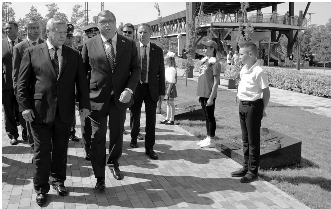
Работа по сохранению памяти в Ростовской области продолжается, сейчас – это имеет особое значение

– Аллея воинской славы и доблести послужит сохранению памяти о великом подвиге нашего народа. И напомнит, с кем сражались наши деды и прадеды. Два города