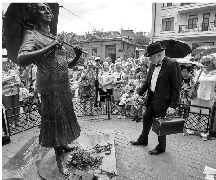
Совместный выпуск Правительства Ростовской области и газеты «Кагальницкие вести»

Развитие туризма в Ростовской области дополнительно поддержат из федерального центра.