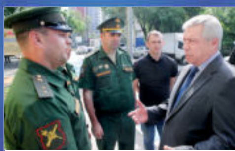
НОВОСТИ ОБЛАСТИ На защите защитников