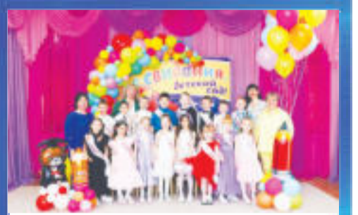
ПРАЗДНИК Первый в жизни выпускной