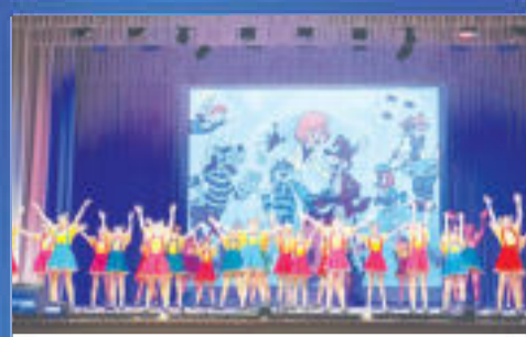
СОБЫТИЕ Защитим наше будущее