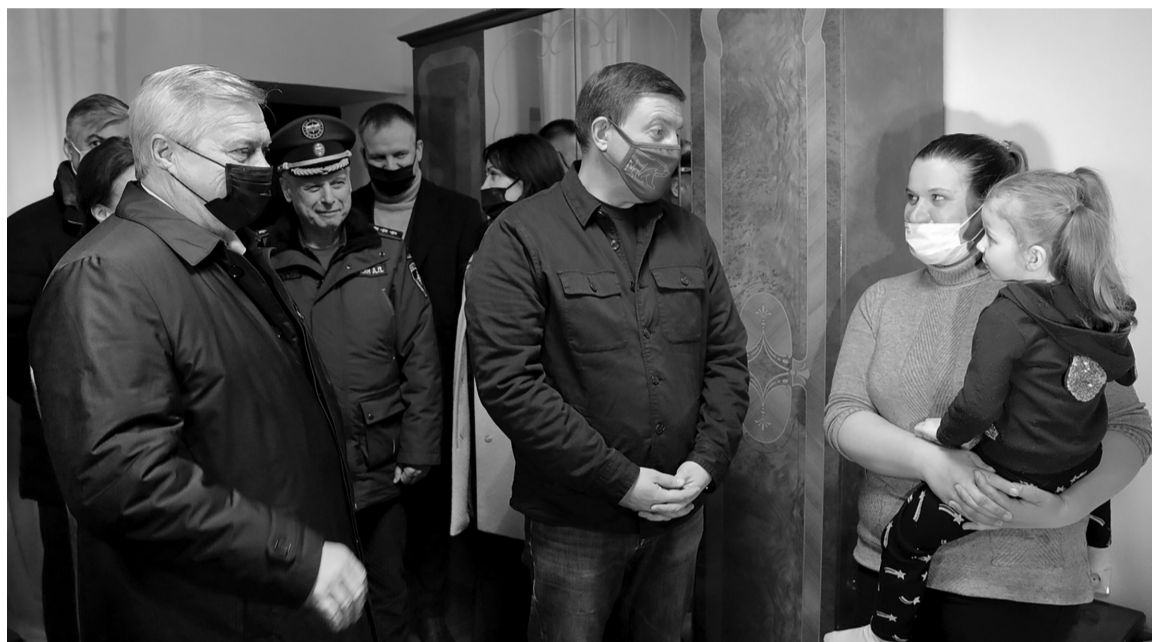
Жители двух новых признанных республик получают максимально возможную помощь и поддержку

Для людей созданы условия проживания, власти страны и региона обеспечивают их всем необходимым: организовывается трехразовое питание, оказывается медицинская помощь. Системно выстроена работа по контролю за санитарным состоянием и регулярной дезинфекцией пунктов временного размещения.