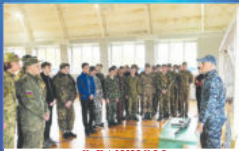
О ВАЖНОМ Школьные военно-полевые сборы