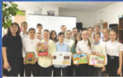
СОБЫТИЕ История России в лицах