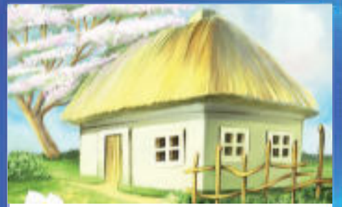
ПРИЛОЖЕНИЕ Наш дом