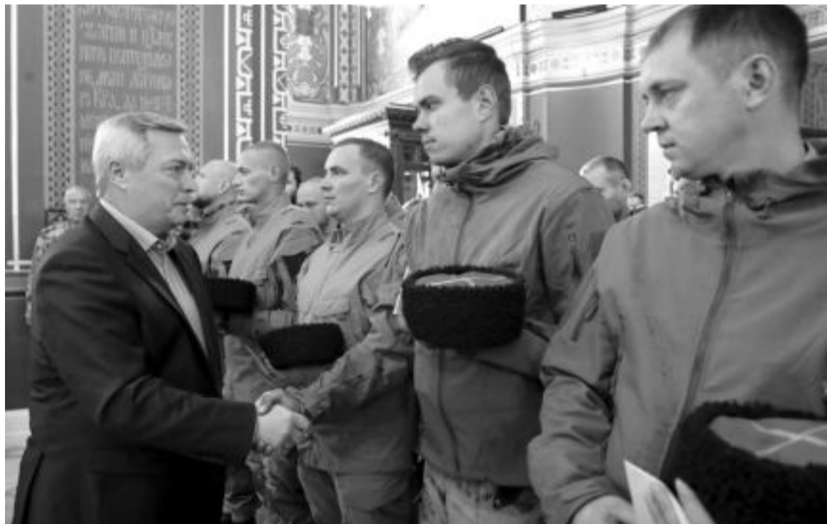
И сегодня на Дону воспитывают новые поколения казаков, любящих Отечество и служащих ему

– Выставки, фестивали, соревнования, викторины, лекции – вот основные виды мероприятий, посвященных Году атамана Платова, – отметил губернатор. – От организаторов каждого из них требуется, чтобы это были настоящие события – интересные, живые и одинаково привлекательные и для молодежи, и для старшего поколения.