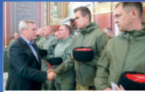
НОВОСТИ ОБЛАСТИ Сила земли Донской