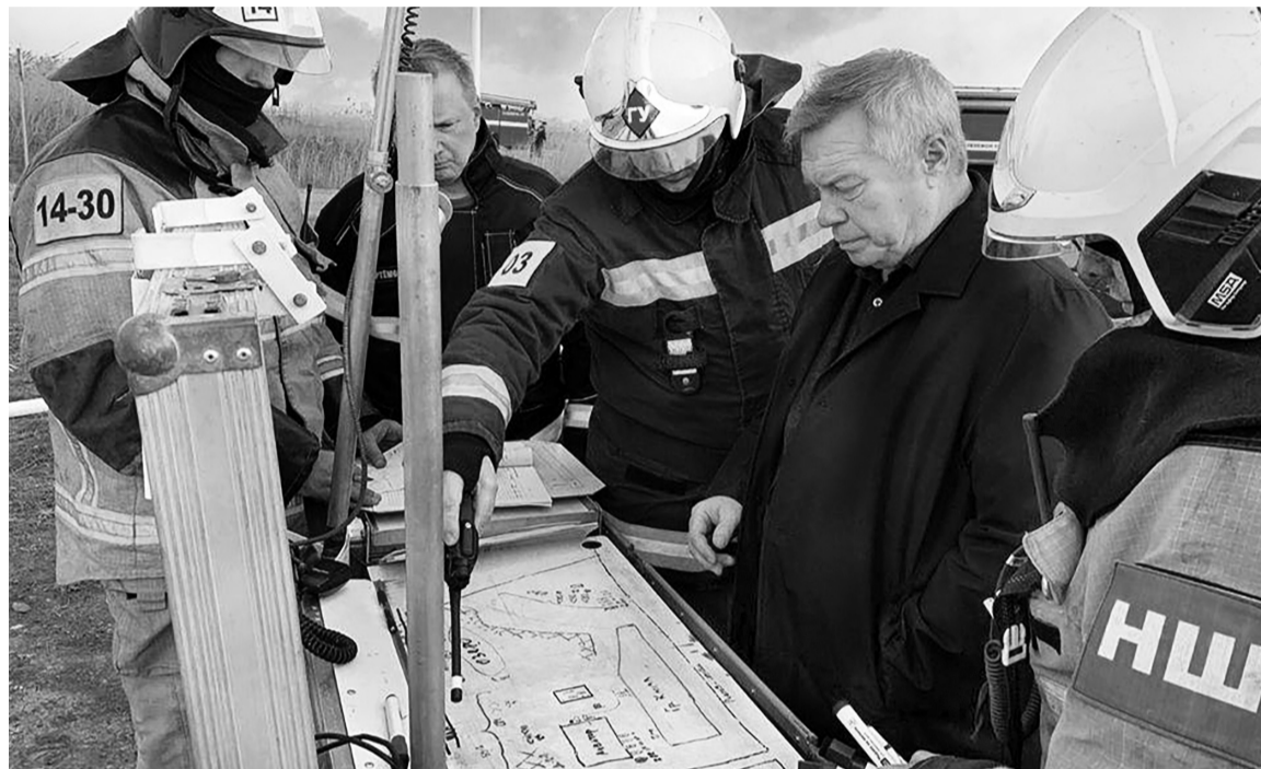
Областная противопожарная служба сейчас работает в усиленном режиме, чтобы защитить жителей региона