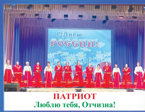
ПАТРИОТ Люблю тебя, Отчизна!