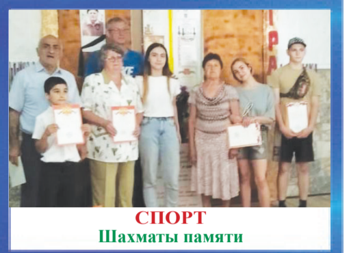
СПОРТ Шахматы памяти