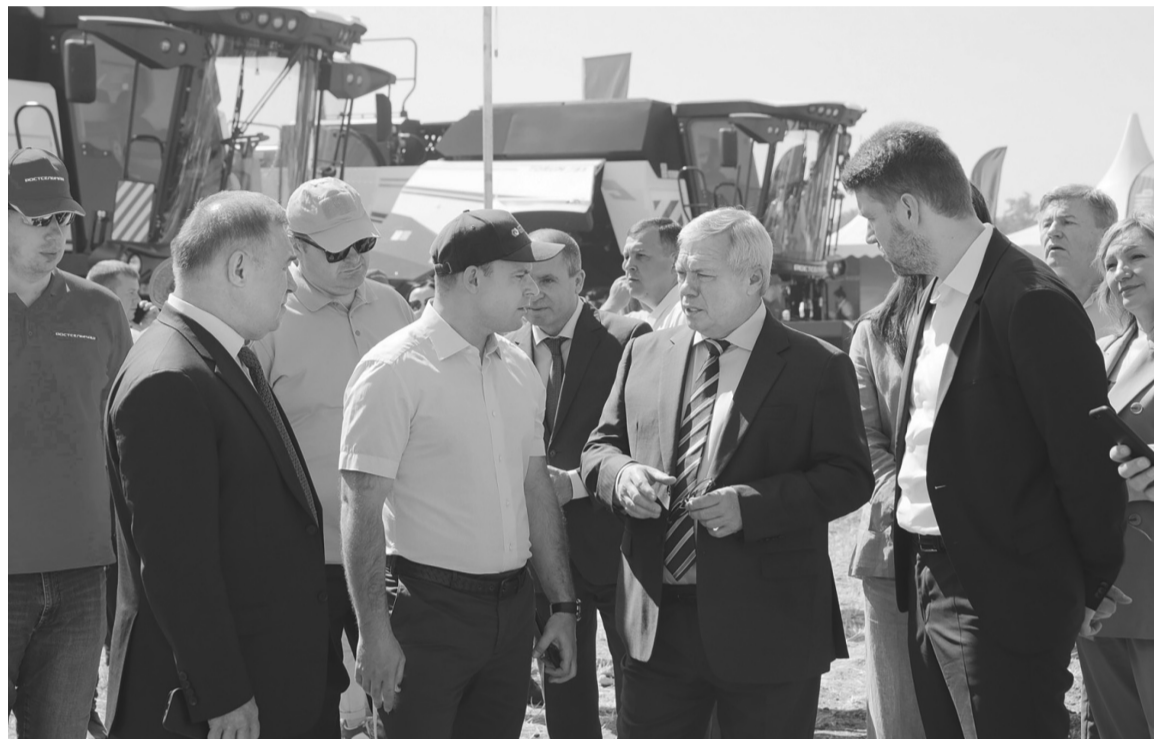
Ростовская область практически готова начать битву за урожай-2023

Самый большой парк сельхозтехники в стране сегодня, как из-