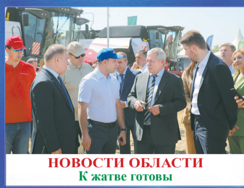
НОВОСТИ ОБЛАСТИ К жатве готовы