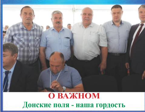
О ВАЖНОМ Донские поля - наша гордость