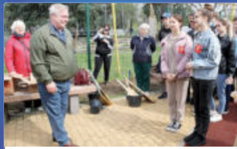
НОВОСТИ ОБЛАСТИ Продолжаем вместе