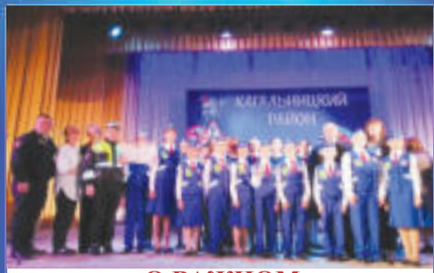
О ВАЖНОМ Служим безопасности дорожного движения!