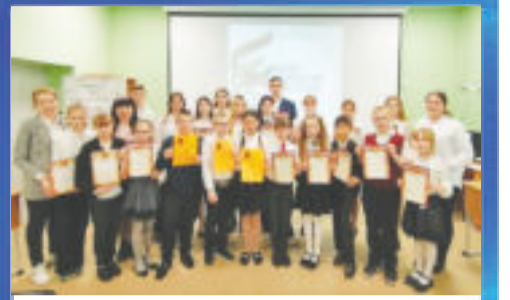
ОБРАЗОВАНИЕ Умные каникулы