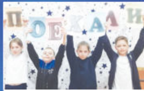
СОБЫТИЕ Первый полет