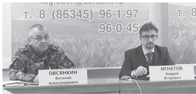
и (или) подпадавшими под воздействие идеологии терроризма. Принимаемые меры по совершенствованию данной работы».

Также рассмотрены вопросы «Об итогах реализации мероприятий Комплексного плана противодействия идеологии терроризма в Российской Федерации на 2019-2023 годы и приоритетных задачах в сфере противодействия идеологии терроризма на плановый период 2024-2028 годы», «Об уровне профессиональной подготовки специалистов, участвующих в индивидуальной профилактической работе с лицами, подверженными