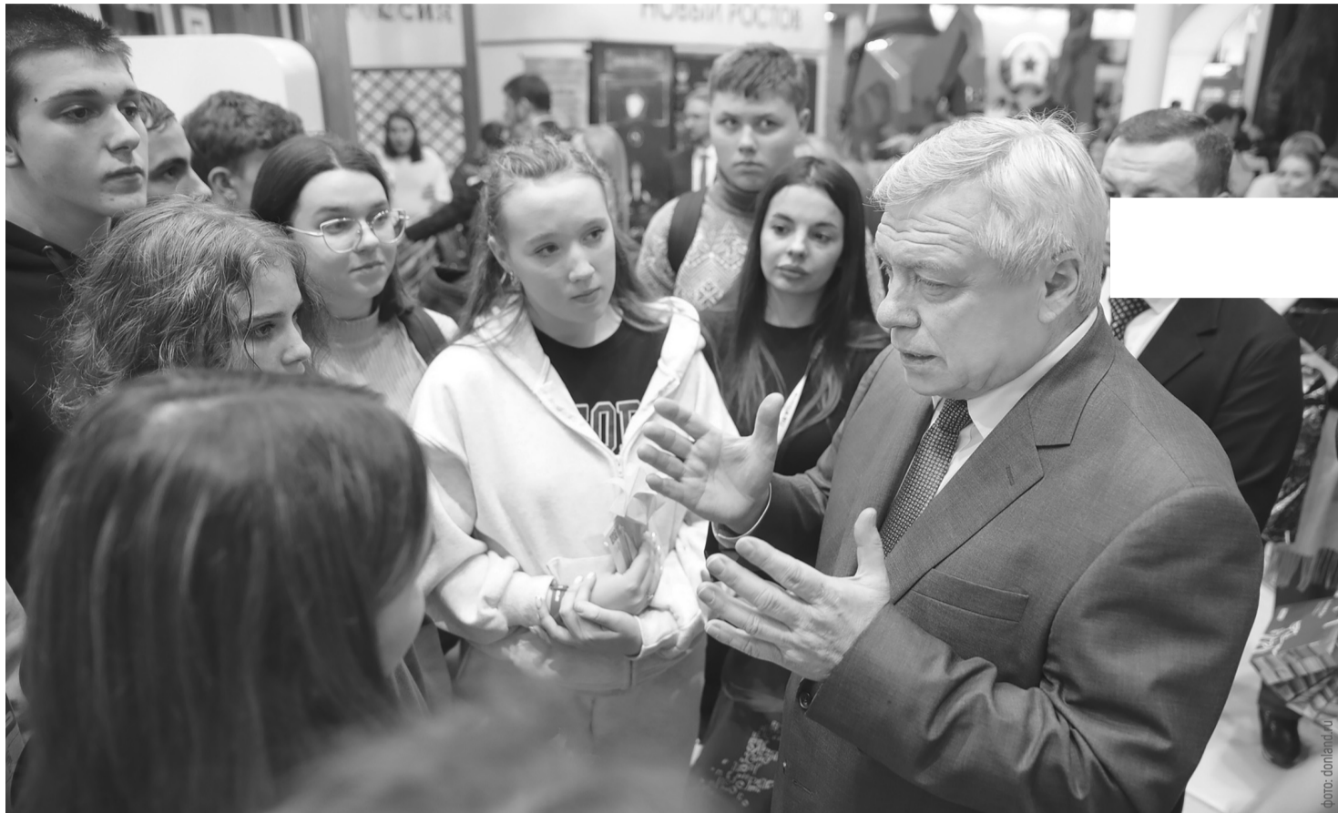
К истории и настоящему Ростовской области интерес проявили самые разные посетители выставки-форума «Россия»

Совместный выпуск Правительства Ростовской области и газеты «Кагальницкие вести»