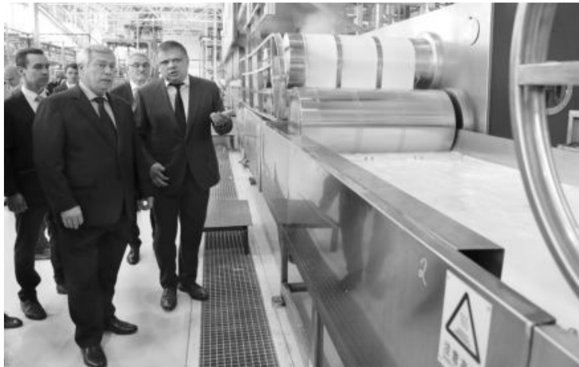
Новые производства – это новые точки развития региона

На предприятиях «Авангарда» трудится более полутора тысяч человек. В мае, напомним, в Шахтах компания запустила современное производство микрофибры – также очень важного материала для всей легкой промыш-