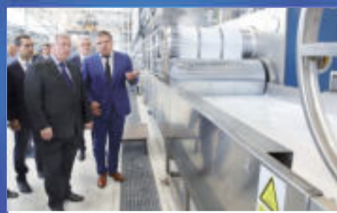
НОВОСТИ ОБЛАСТИ Промышленное пополнение