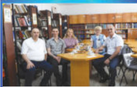
О ВАЖНОМ Герои живут среди нас