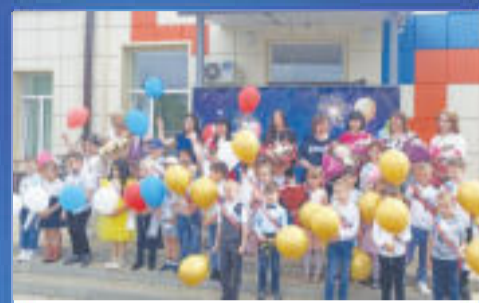
СОБЫТИЕ Скоро в первый класс!