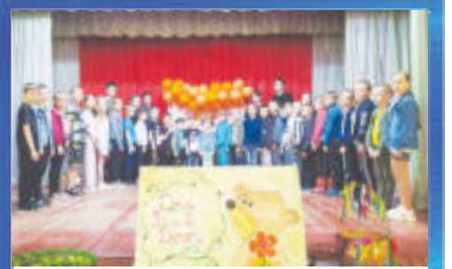
ПРАЗДНИК Казачьи игры и забавы