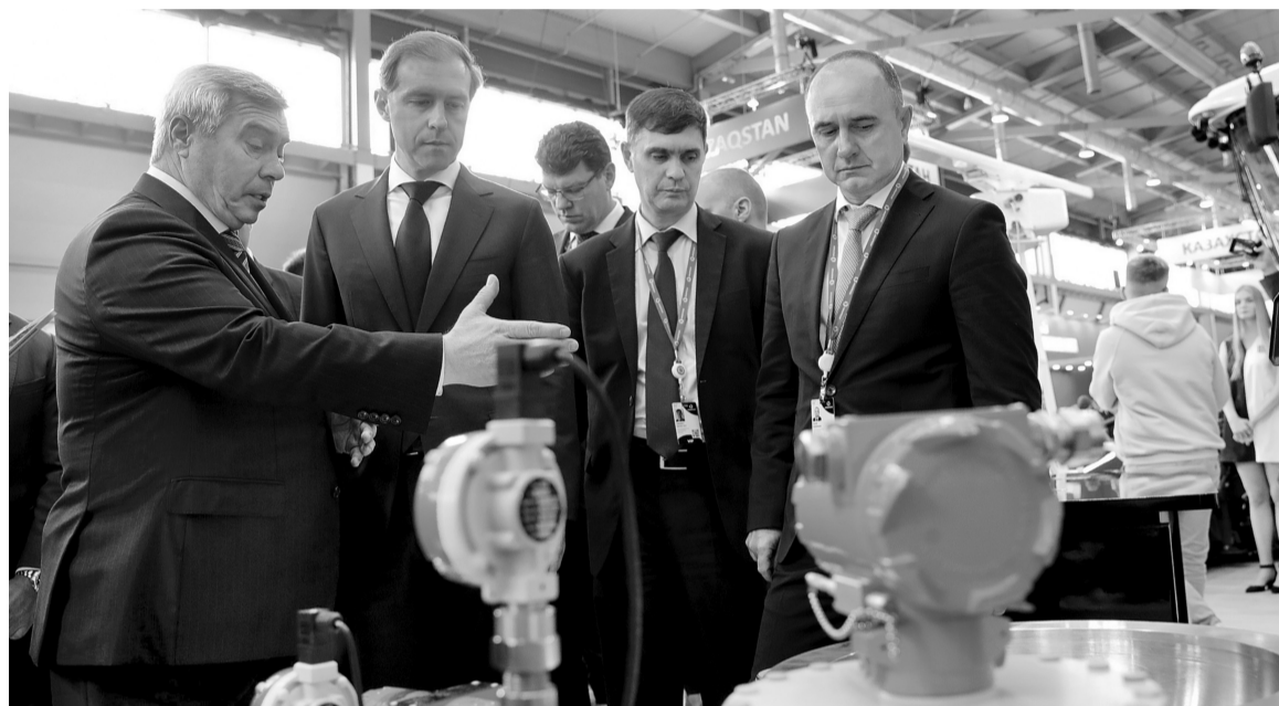
«Иннопром-2022» открыл для Ростовской области новые перспективы развития

Больше десятка соглашений с акцентом на импортозамещение и общим объемом инвестиций более чем 31 млрд рублей, развитие новых сфер и укрепление уже имеющихся позиций – таковы результаты участия Ростовской области в международной промышленной выставке «Иннопром-2022».