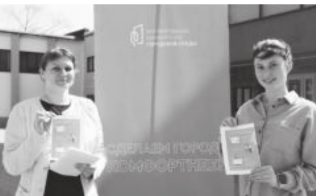
za.gorodsreda.ru и продлится до 31 мая.

Напомним, Всероссийское голосование за выбор объектов благоустройства проходит на платформе