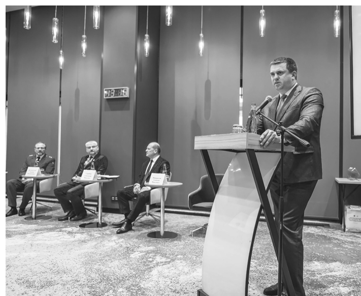
Совместный выпуск Правительства Ростовской области и газеты «Кагальницкие вести»

На ежегодной региональной конференции «Защита прав потребителей» названы лучшие в этом году производители и поставщики услуг.