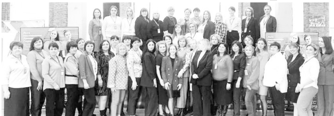
Местное отделение РДДМ «Движение первых» выражает огромную благодарность наставникам за неравнодушие, искренний интерес и помощь в развитии движения на территории Кагальницкого района!