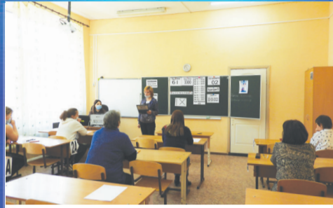
О ВАЖНОМ ЕГЭ для родителей