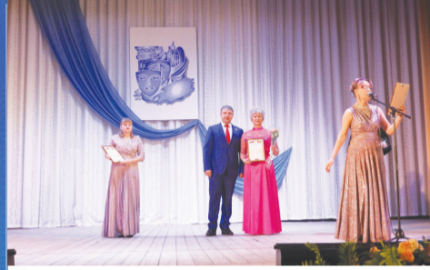
СОБЫТИЕ Ее величество - культура