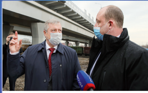
НОВОСТИ ОБЛАСТИ Нужно ускориться