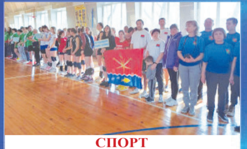
СПОРТ Открытие муниципального этапа Спартакиады Дона