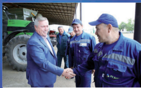
НОВОСТИ ОБЛАСТИ В поле - воины