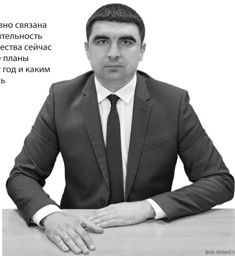
Замгубернатора уверен, что у донского казачьего образования – большие перспективы

– Безусловно. Общая численность обучающихся в образовательных организациях, реализующих казачий компонент, более