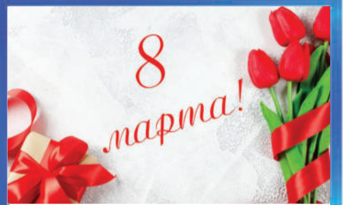
ПРАЗДНИК С Международным женским днем!