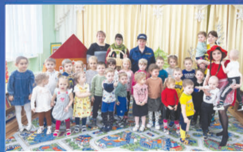
ОБРАЗОВАНИЕ Уберечь и научить