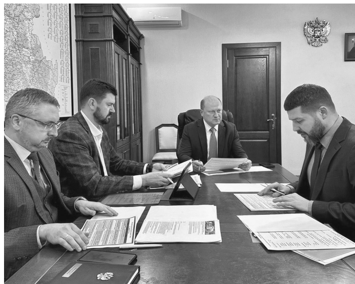
Совместный выпуск Правительства Ростовской области и газеты «Кагальницкие вести»

По итогам прошлого года количество гарантийных поручительств донским предпринимателям выросло на треть.