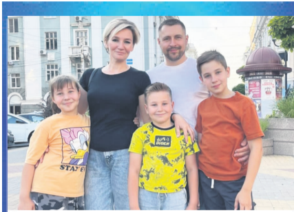
НАШИ ЛЮДИ Простой рецепт семейного счастья

Общественно-политическая газета Кагальницкого района Издается с 28 декабря 2002 года