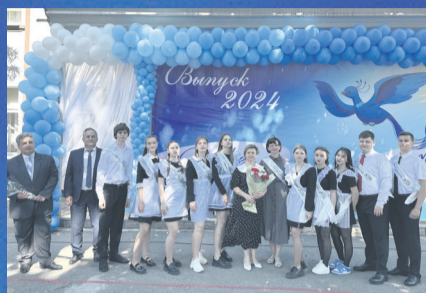
ПРАЗДНИК Вперед, за Синей Птицей!