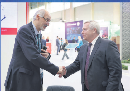
НОВОСТИ ОБЛАСТИ Взгляд на восток