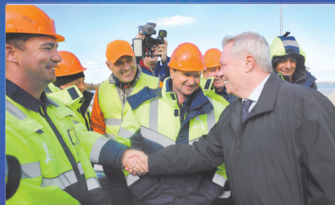
НОВОСТИ ОБЛАСТИ Старт с высокой базы