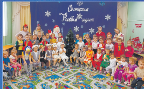
ПРАЗДНИК Коляда, Коляда, открывай ворота!