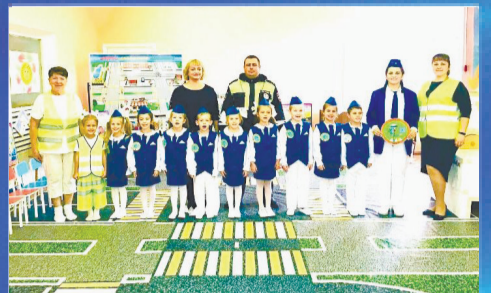
ПРАВОПОРЯДОК Сказочная победа