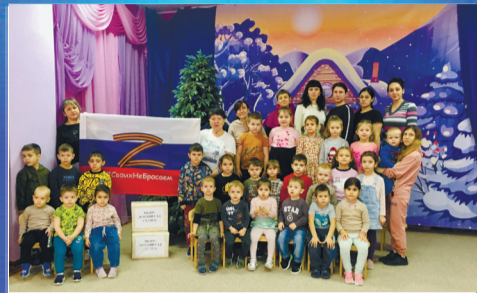
О ВАЖНОМ Подарки для патриотов