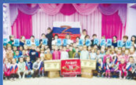
ПАТРИОТ Подарок солдату