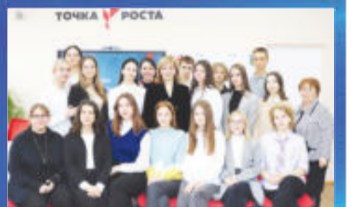
ОБРАЗОВАНИЕ Даешь финансовую грамотность!