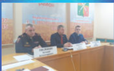
О ВАЖНОМ Коррупции бой!