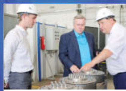
НОВОСТИ ОБЛАСТИ Действовать вместе