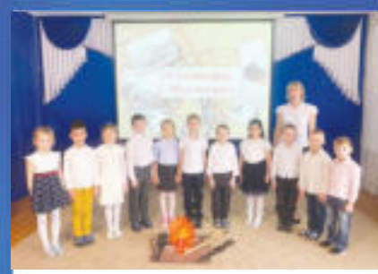
ПАТРИОТ Любовь к Родине