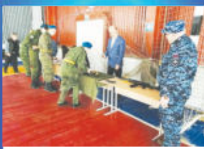
О ВАЖНОМ Юность на страже Отечества