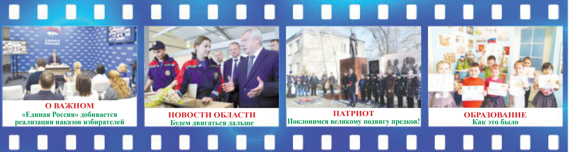
О ВАЖНОМ «Единая Россия» добивается реализации наказов избирателей