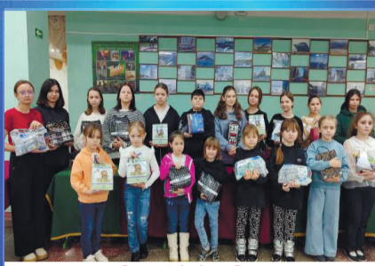
О ВАЖНОМ Подарок солдату