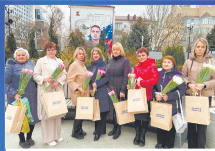
ПРАЗДНИК Подарить искусство