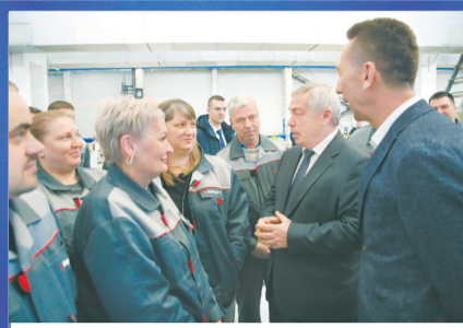
НОВОСТИ ОБЛАСТИ Большой шаг