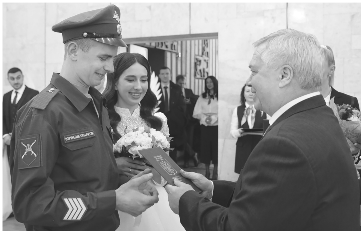
Каждая новая семья – вклад в будущее региона, уверен донской глава

Исторически так сложилось, что на Дону чтят семейные традиции и почитают многодетность.