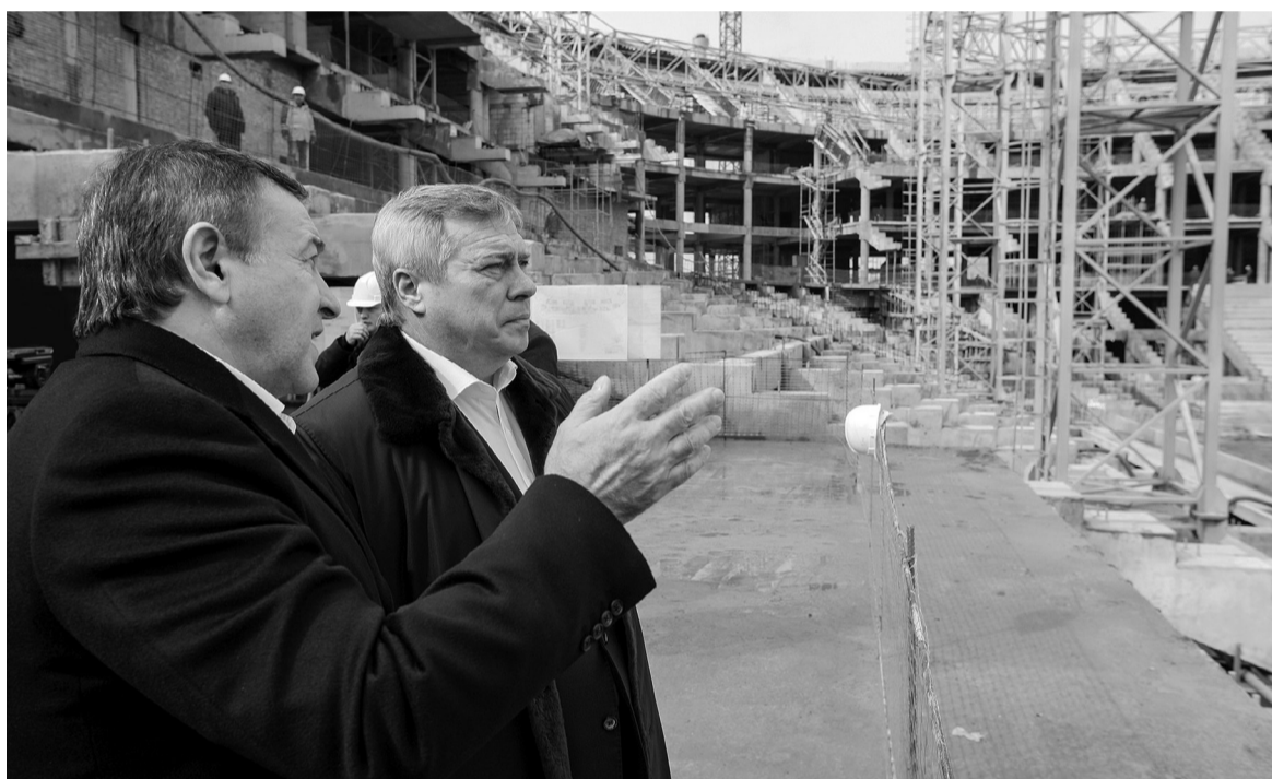
● «Ростов-арена» с каждым днем приобретает все более осязаемые черты

Масштабная стройка позволяет вписаться в программу импортозамещения, то есть