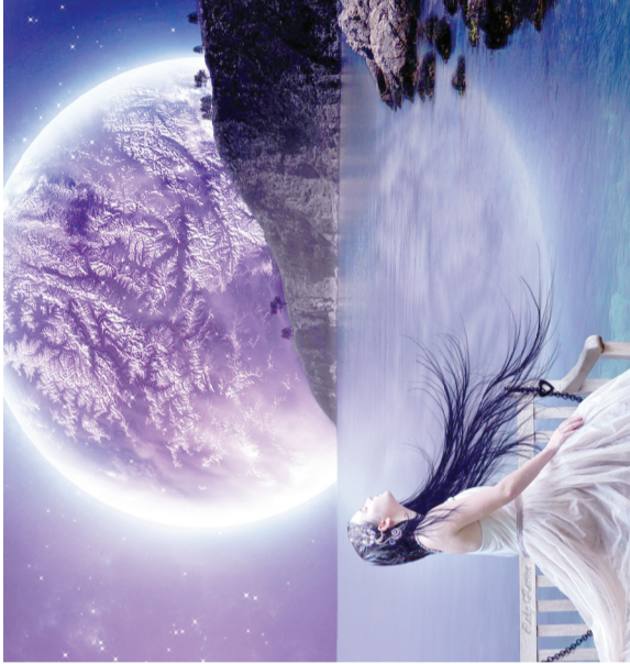
Чай для волос

30 ноября. Если вы хотите улучшить здоровье своих волос, отправляйтесь подстричься в этот день, а покраска в натуральный цвет принесет удачу.