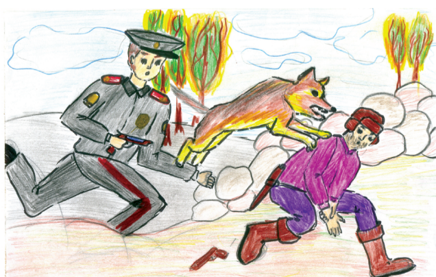
«Полиция спешит на помощь» рисунок А. Детистова, ученика 4 «б» класса Кировской СОШ № 4

председатель общественного совета при отделе МВД России по Кагальницкому району