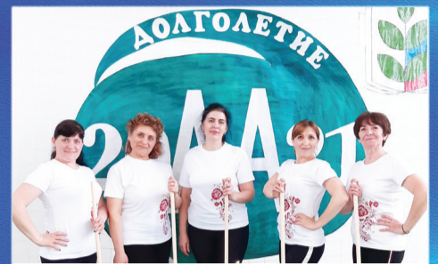
СПОРТ Здоровье в порядке – спасибо зарядке!