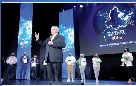
НОВОСТИ ОБЛАСТИ Бизнес года: наши лучшие