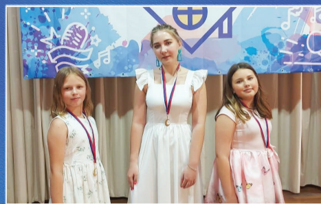
ОБРАЗОВАНИЕ Творческие победы