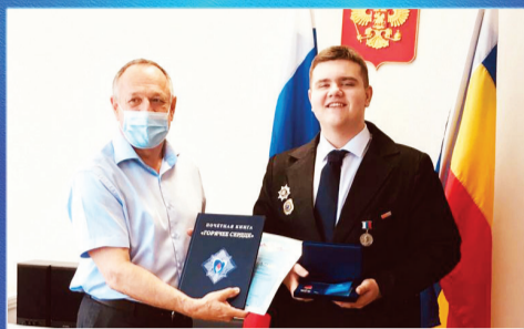
СОЦИУМ Надежный человек