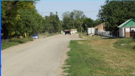
О важном Спорные вопросы решены