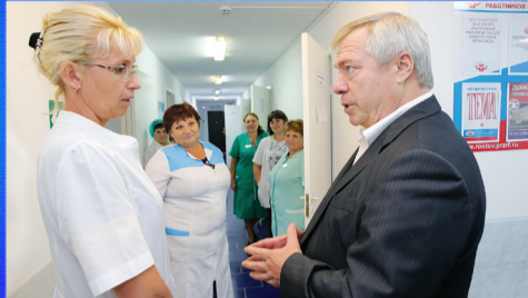
Новости области Кадры решают все