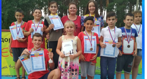
Спорт Бронзовые призы по шахматам