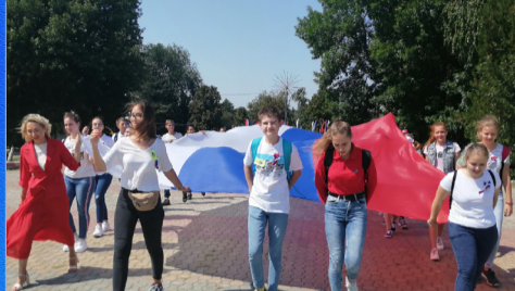
Образование Душа России в символах ее