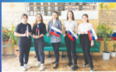
О ВАЖНОМ Гордость за Отчизну