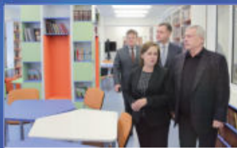
НОВОСТИ ОБЛАСТИ Будем двигаться дальше