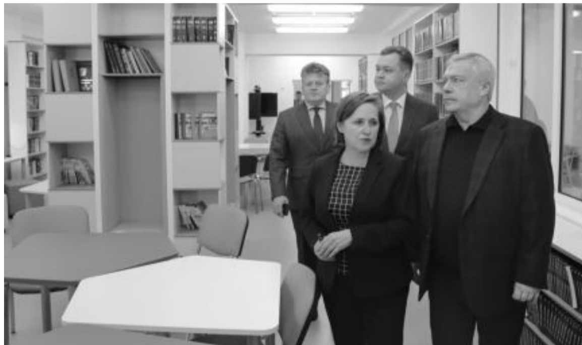
Создание мест в школах, поддержка детских инициатив и движения детей и молодежи «Движение первых» на местах – по мнению губернатора сейчас очень необходимо

работает донское здравоохранение. С 1 января все медицинские организации переданы в областную собственность, однако в этот переходный период они остро нуждаются во внимании местных властей.