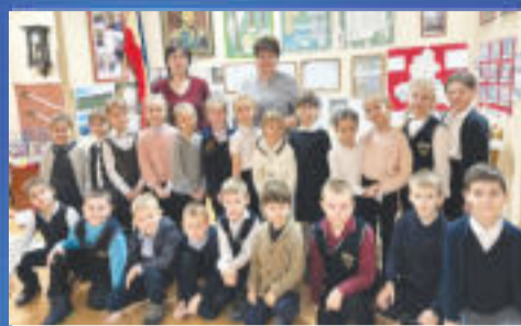
ПРАЗДНИК День памяти атамана Платова