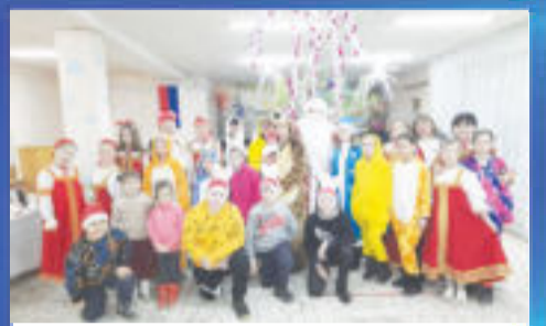
ПРАЗДНИК Уважая традиции