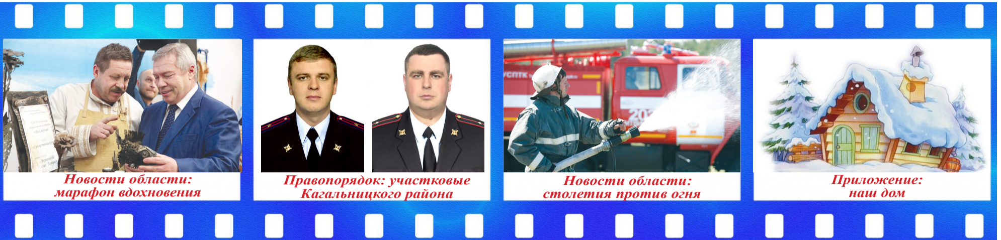
Новости области: марафон вдохновения