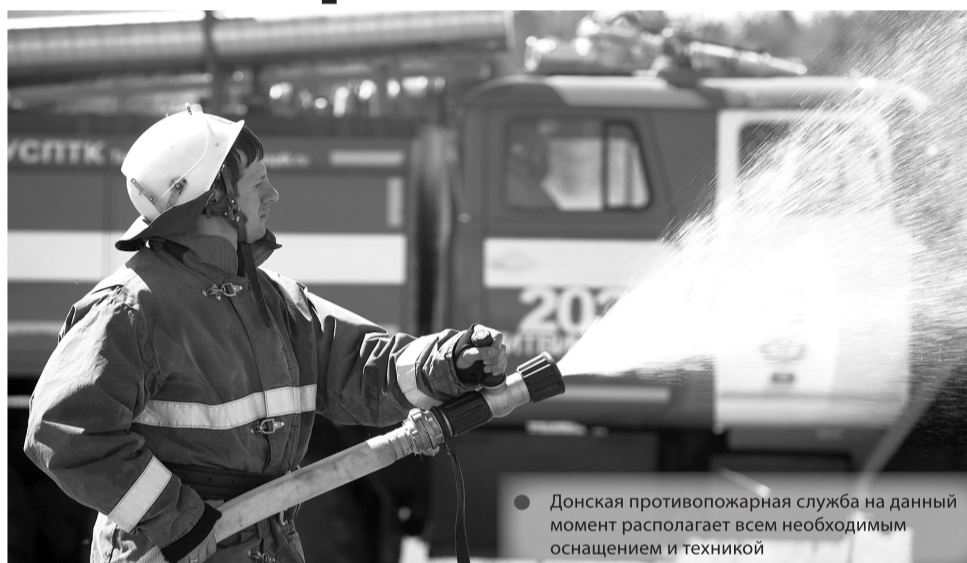
Донская противопожарная служба на данный момент располагает всем необходимым оснащением и техникой

да и первые казачьи станицы, рабочие поселки близ шахт, оживленные торговые станицы. Пожарные депо в то время базировались в ветхих сараях, в них – минимум необходимого инструмента, пара или тройка лошадей.