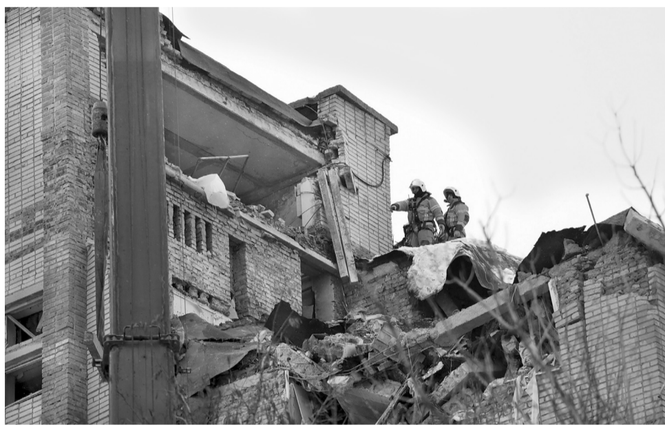
● На ликвидацию последствий ЧС в Шахтах спасателям потребовалось меньше 3000 минут

– Двое суток специалисты служб экстренного реагирования, сменяя друг друга, разбирали завалы, – рассказывает Вадим Артемов. – Работали на совесть,