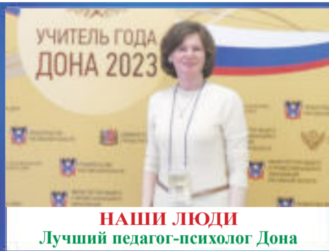
НАШИ ЛЮДИ Лучший педагог-психолог Дона