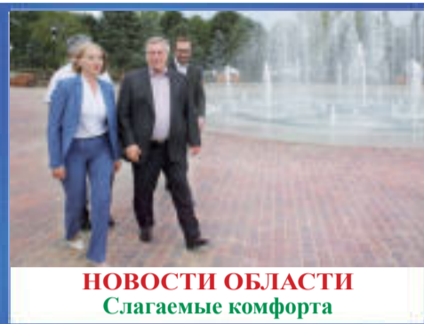
НОВОСТИ ОБЛАСТИ Слагаемые комфорта