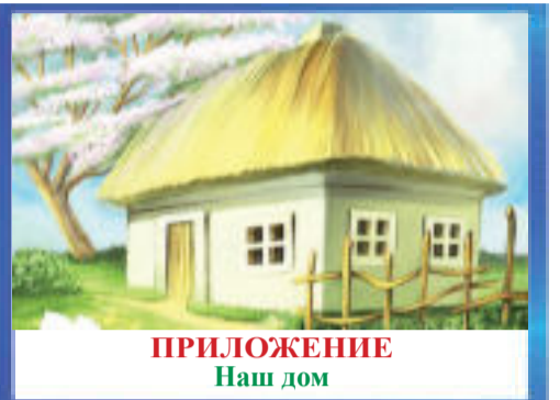
ПРИЛОЖЕНИЕ Наш дом