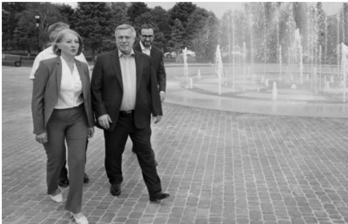
Любой населенный пункт может быть удобным и приятным для жизни – нужно только приложить усилия

В Ростовской области федеральный проект «Формирование комфортной городской среды» реализуется с 2017 года. За это время благоустроено 876 объектов, в том числе 181 дворовая территория в 55 муниципалитетах, на все работы направлено более 11 млрд рублей.