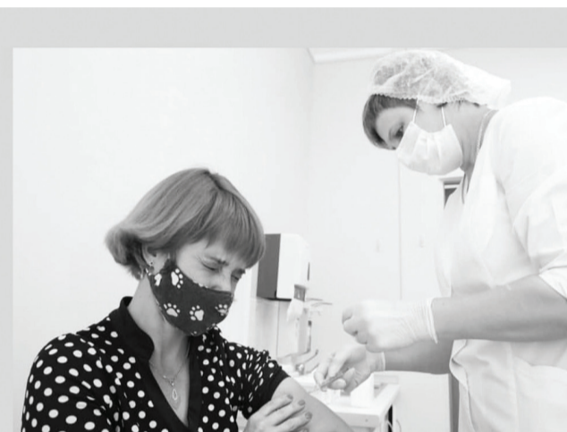
Всего в 2021 году планируется вакцинировать 60% населения России, это 68,6 миллиона

«В марте в оборот дополнительно поступит вакцина „ЭпиВакКорона“ центра „Вектор“, а в апреле — вакцина „КовиВак“ центра имени Чумакова»