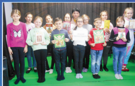
СОЦИУМ Волшебный мир сказок