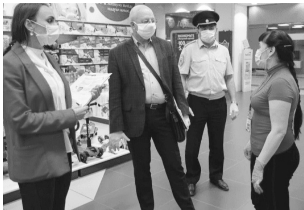
За весь период работы по вопросу соблюдения масочного режима (ст. 20.6.1) в Кагальницком

По поручению губернатора Ростовской области Василия Юрьевича Голубева во всех муниципалитетах Ростовской области организован постоянный мониторинг соблюдения масочного режима.