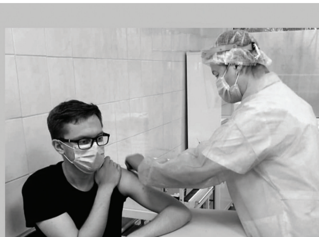
МАССОВАЯ ВАКЦИНАЦИЯ ЖИТЕЛЕЙ РОССИИ ИДЁТ ВОВСЮ: УЖЕ ПРИВИТЫ БОЛЕЕ МИЛЛИОНА ЧЕЛОВЕК