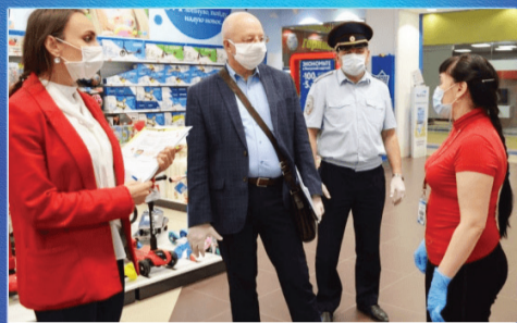
О ВАЖНОМ Мониторинг масочного режима