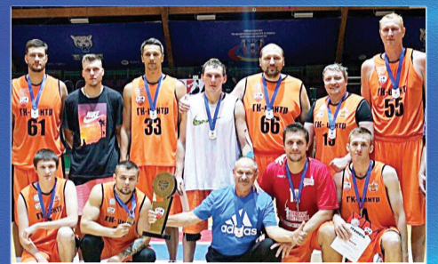
СПОРТ ИкрOMETная игра