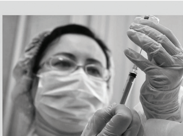
На этом этапе прививки ставят вакциной «Спутник V», до марта этот препарат останется основным