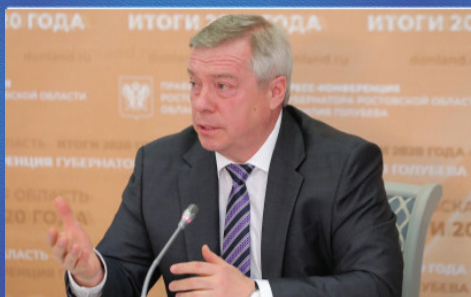
О ВАЖНОМ Пресс-конференция Губернатора РО