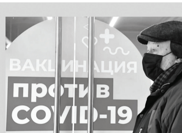
Привив такое количество жителей, Россия получит коллективный иммунитет и действительно победит коронавирус