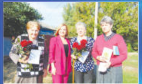
СОЦИУМ От всей души с поклоном и любовью