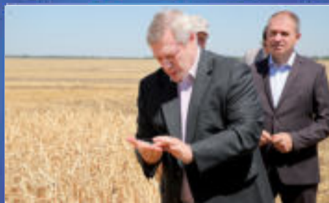
НОВОСТИ ОБЛАСТИ Рациональное зерно