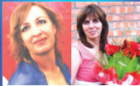
НАШИ ЛЮДИ Юбиляры