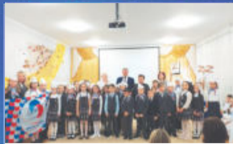
ОБРАЗОВАНИЕ Спасибо за тепло сердец