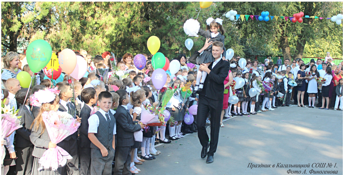
Праздник в Кагальницкой СОШ № 1.

В школы возвратились ученики - отдохнувшие, загоревшие, подросшие. На линейках для них, учителей и родителей из уст представителей районной Администрации и сельских поселений, общественности и меценатов прозвучали поздравления с началом нового учебного года и пожелания предстоящих успехов. Нарядные участники праздничного действа, торжественная музыка, стихи и песни, пышные букеты и яркие шары - таким повсеместно был День знаний в Кагальницком районе.