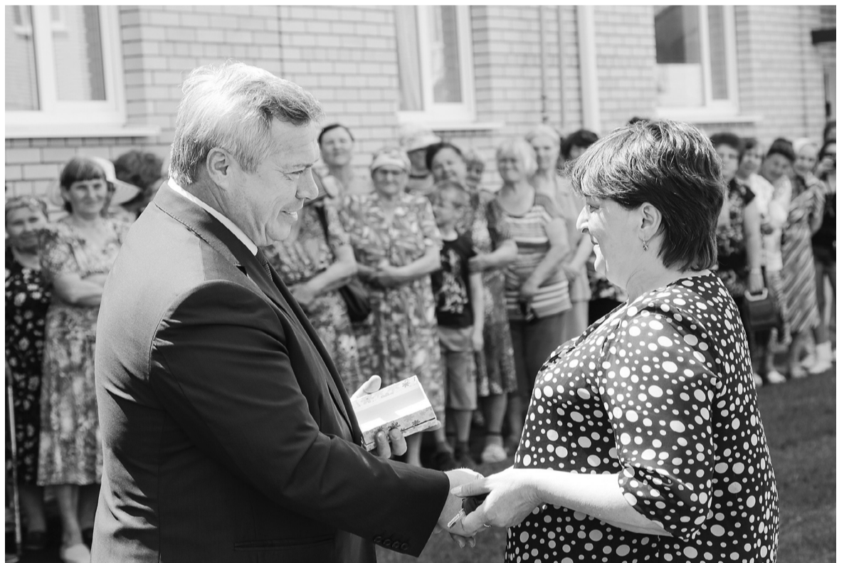
● Счастливыми обладателями ключей от новых квартир, взамен аварийных, стали жители Тагинского района

Аналогичная «жилищно-аварийная» ситуация не только в