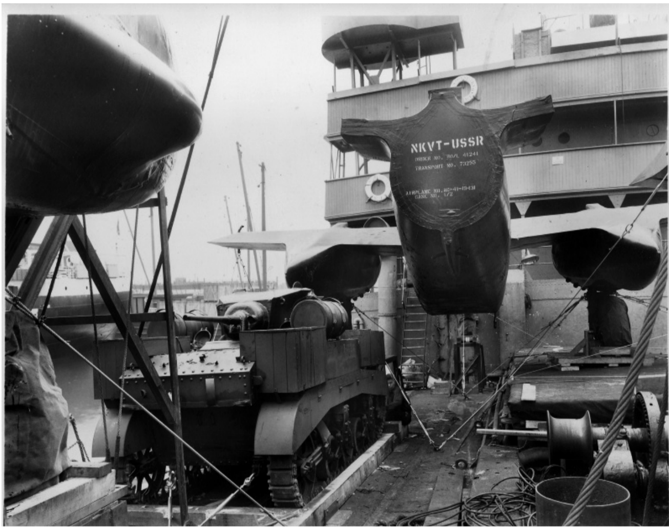
Поставки вооружения и техники по ленд-лизу имели лишь ограниченное влияние на ход событий на советско-германском фронте. Фото 1941 года