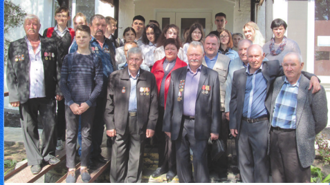
Эхо праздника: горькая память и вечная боль