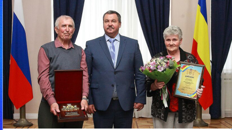
Социум: семья - главная ценность