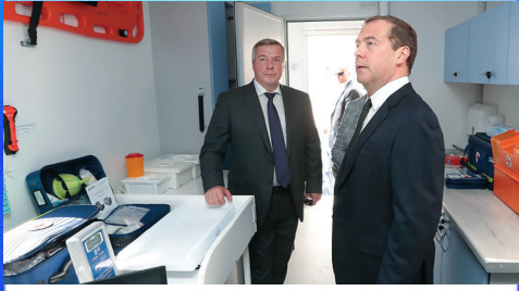
Новости области: с особой заботой