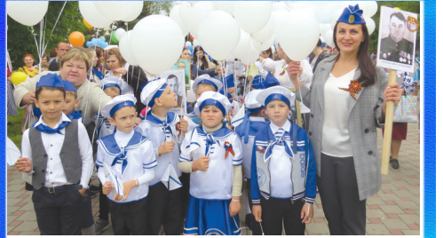
Образование: не забыт солдат Победы!