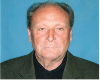
Социум: его жизненное кредо - верность призванию!