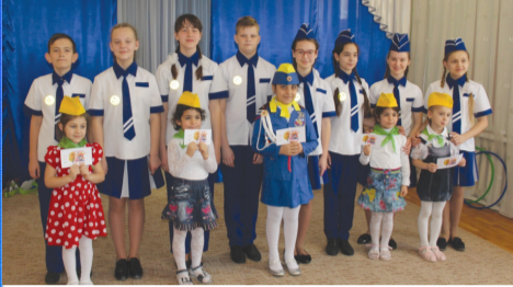
Детство: ЮИД в гостях у самых маленьких