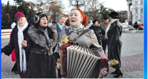
События: Крымская весна: пять лет вместе