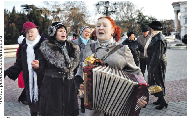
Горожанки поют на улице старые советские песни. Севастополь, ноябрь 2014 года

Продолжилась и материальная помощь полуострову. В Крым и в Красногвардейский район направляли денежные средства, компьютерную и оргтехнику, спортивный инвентарь. Помогли с