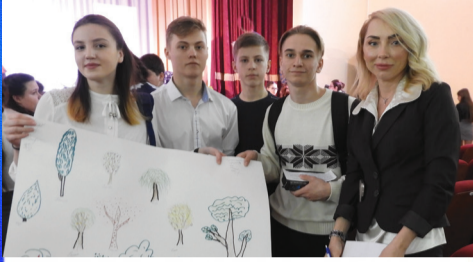
Детство: молодежная команда Губернатора