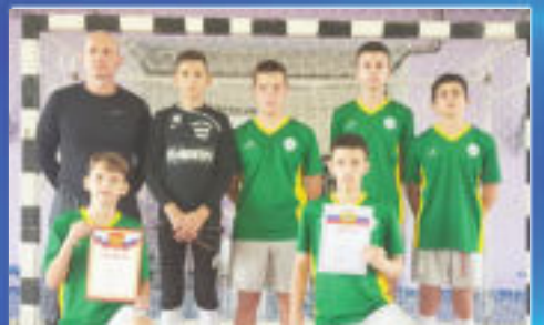
СПОРТ Соревнования по мини-футболу