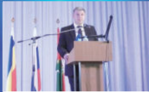
О ВАЖНОМ Отчет главы перед народом