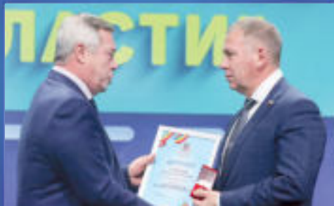
НОВОСТИ ОБЛАСТИ Такая простая мотивация