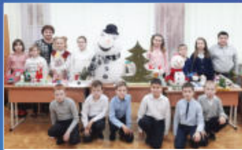
ТРАДИЦИИ Удивительный праздник