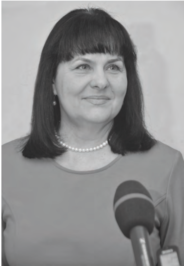
Проводимые мероприятия находят поддержку среди граждан.

В рамках проекта «Народный контроль» ежемесячно во всех муниципальных образованиях рабочими и мобильными группами проводится мониторинг цен на 24 вида продуктов. Особое внимание обращалось на проведение контрольных мероприятий, направленных на предотвращение необоснованного роста цен на предоставляемые услуги и товары.