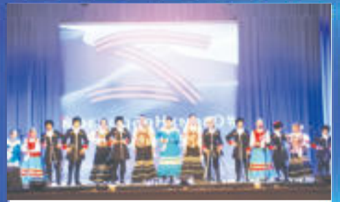
ПАТРИОТ Победа будет за нами!