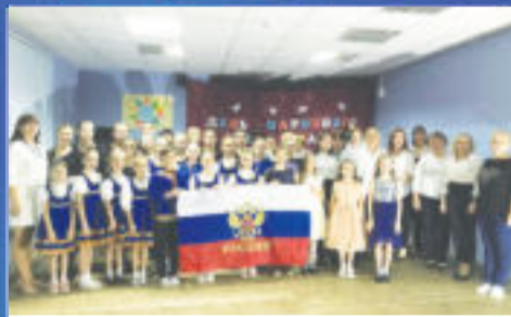
СОБЫТИЕ Единым духом мы сильны