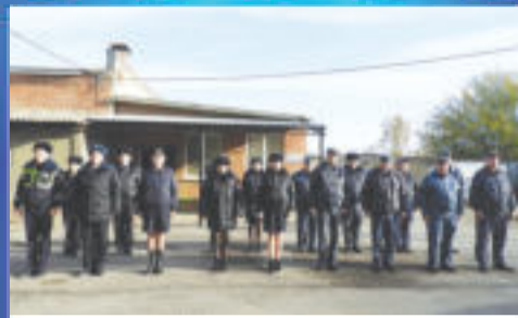
О ВАЖНОМ С профессиональным праздником!