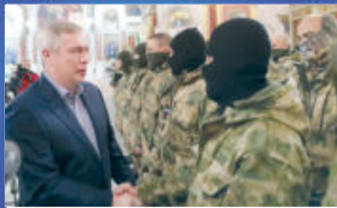
НОВОСТИ ОБЛАСТИ Настоящий мужской выбор