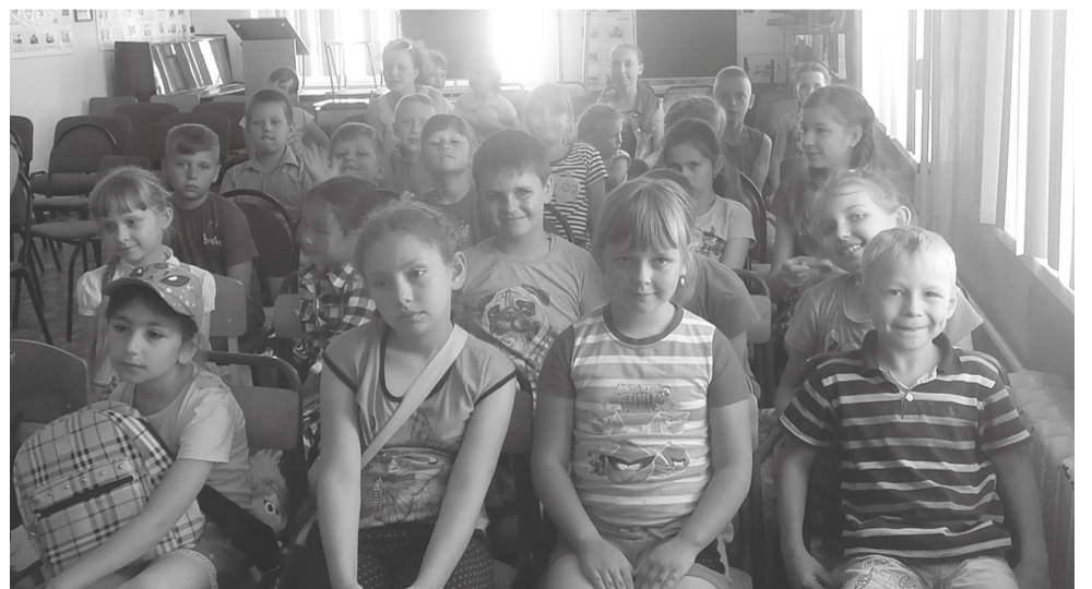
Материалы полосы к печати подготовила Н. Александрова

Т.В. Белоусова, методист Кагальницкой МЦБ