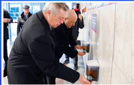
Новости области Выдержать испытание