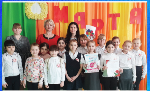
Эхо праздника Праздник весны