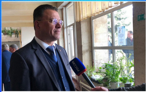
О важном Ростовская экономика