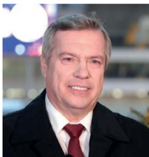
ВАСИЛИЙ ГОЛУБЕВ, ГУБЕРНАТОР РОСТОВСКОЙ ОБЛАСТИ

«Развитие малого и среднего бизнеса — это дополнительные налоги в бюджет региона и новые рабочие места для его жителей».